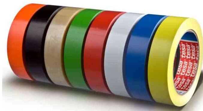
Adhésifs d'emballage 4104, en PVC, en couleur