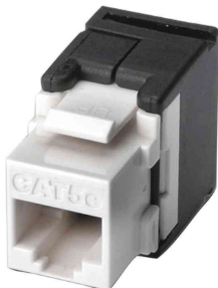
Keystone Modul Kat. 5e, Klasse D