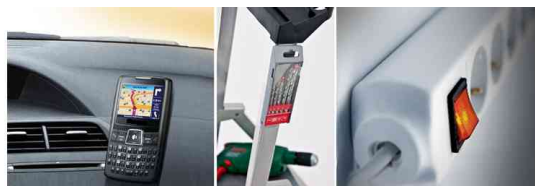
Dual Lock Klett-power SJ3560, exemples d'utilisation