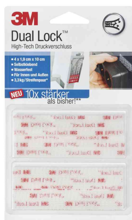
Dual Lock Klett-Power SJ3560