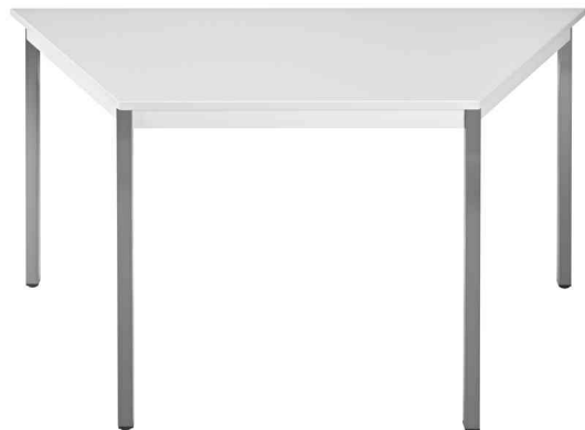
Table de réunion modulaire, gris clair

- idéal pour une combinaison avec les autres tables de 700 mm, pour les salles de repos, d'attente et cantines etc.