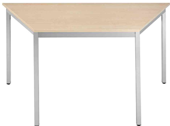
Table de réunion modulaire, érable

- idéal pour une combinaison avec les autres tables de 700 mm, pour les salles de repos, d'attente et cantines etc.