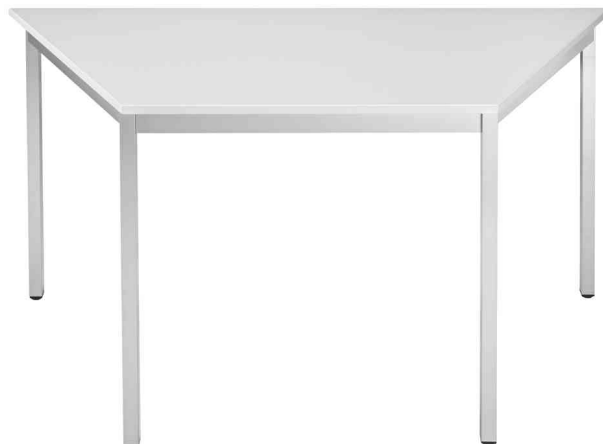
Table de réunion modulaire, gris clair