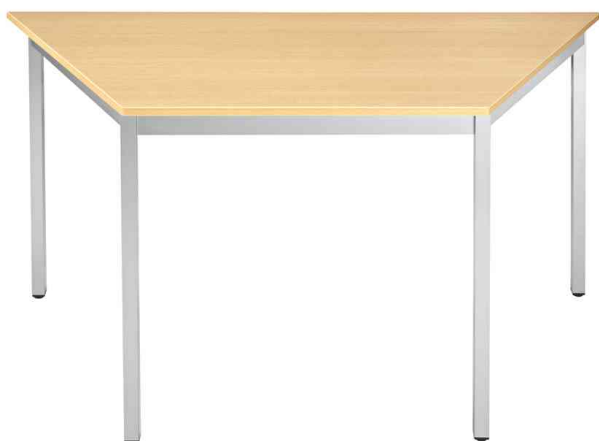
Table de réunion modulaire, hêtre