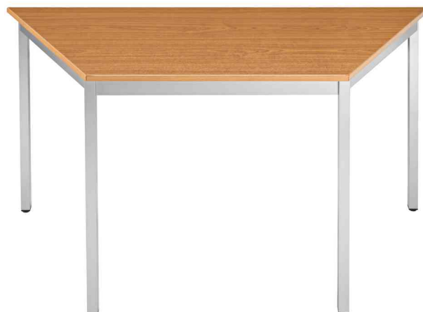
Table de réunion modulaire, merisier