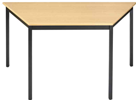
Table de réunion modulaire, hêtre

- idéal pour une combinaison avec les autres tables de 600 mm, pour les salles de repos, d'attente et cantines etc.