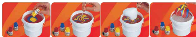
Peinture à marbrer Hobby Line "Magic Marble", utilisation