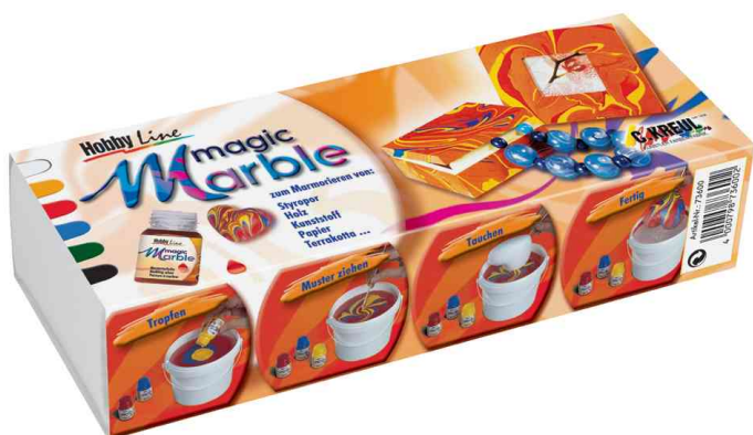
Peinture à marbrer Hobby Line "Magic Marble", set de couleurs