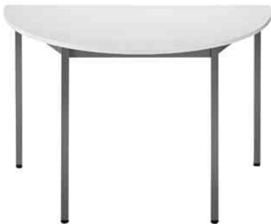
Table de réunion modulaire, gris clair

- idéal pour être combinée avec d'autres tables dans les salles de repos, les salles d'attente et les cantines etc.