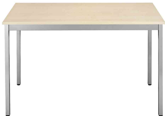
Table universelle, érable