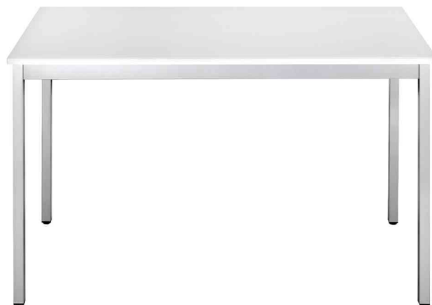
Table universelle, gris clair