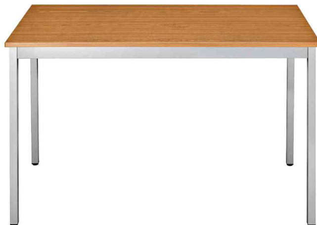
Table universelle, merisier