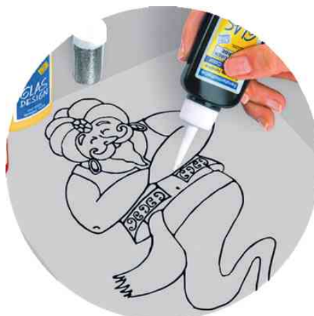
Peinture de contours pour Window Color Hobby Line "Glas Design", utilisation