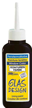
Peinture de contours pour Window Color Hobby Line "Glas Design"