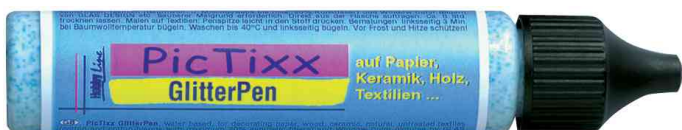
GlitterPen Hobby Line "PicTixx"