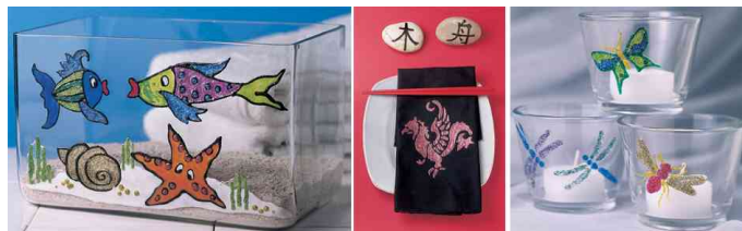
GlitterPen Hobby Line "PicTixx", utilisation