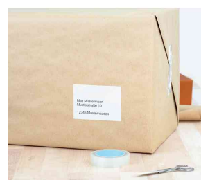
Etiquettes universelles PREMIUM, utilisation