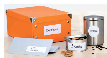
Etiquettes universelles PREMIUM, utilisation