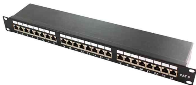
Patch Panel 19" cat. 6