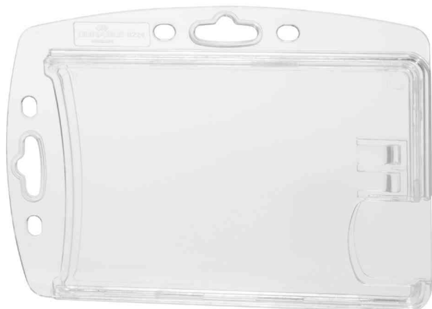
Namensschilder Doppelbox, Daumenstanzung