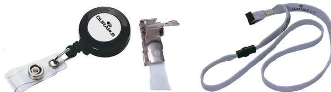
Accessoires: détendeur de la carte - clip de recharge - lacet textile 10, gris