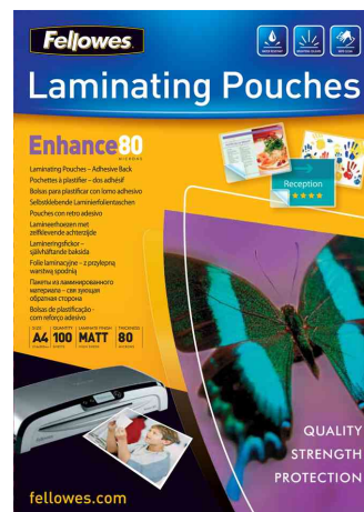
Laminierfolientaschen, selbstklebend (Enhance)