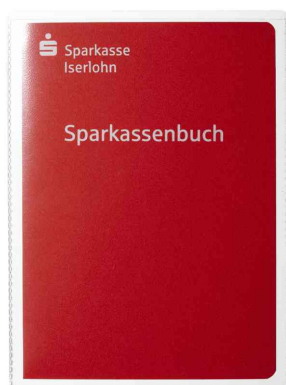
(5) Pochettes de protection, A6