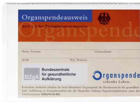
(4) Pochettes de protection, A7