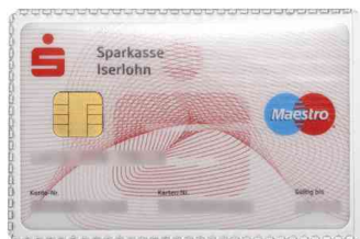
(1) Pochettes de protection, 54 x 86 mm