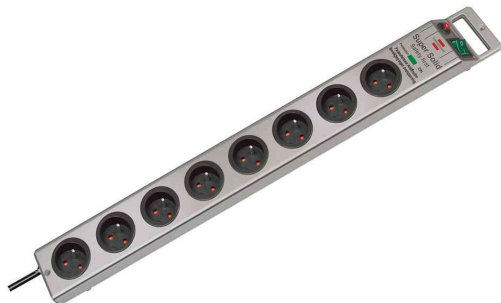
Steckdosenleiste Super-Solid, 8-fach