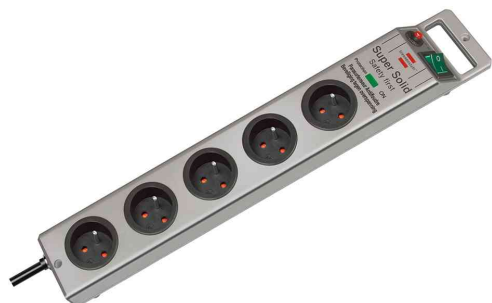
Steckdosenleiste Super-Solid, 5-fach