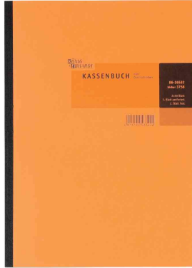
Kassenbuch DIN A4, Bruttoverbuchung