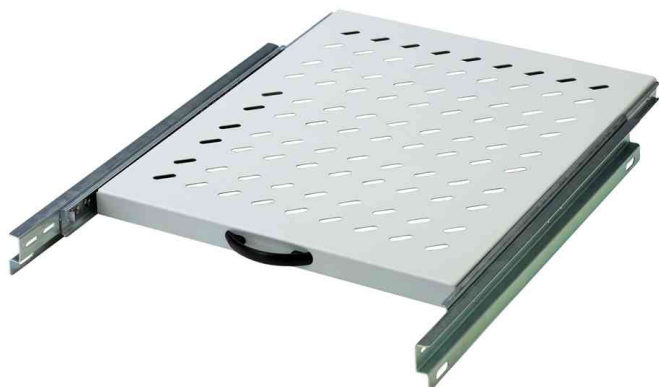
Etagères 19", fixation à l'avant et à l'arrière, gris

numero de commande: 11001675 / 1103863: convient à la baie serveur DIGITUS montée et non-montée 19" ayant une profondeur de 800 mm • dimensions: (L)465 x (P)525 x (H)30 mm