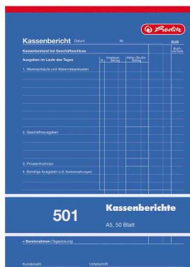
Formularbuch - Kassenbericht