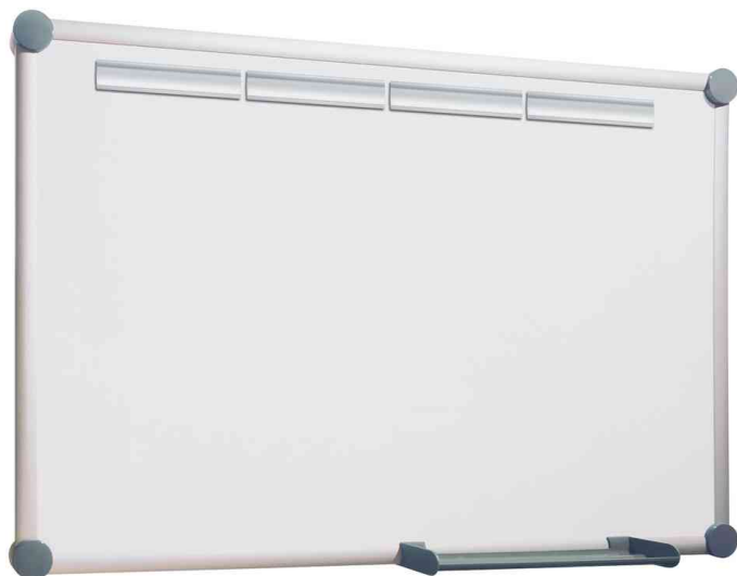
Set complet plus tableau blanc 2000

livré dans un carton incl. matériel de montage