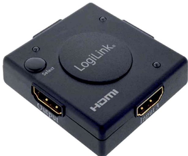
Mini commutateur HDMI avec amplificateur, 3 ports

- pour connecter jusqu'à 3 appareils à un téléviseur ou un projecteur, par ex. receiver, lecteur DVD, receiver TV, console de jeu