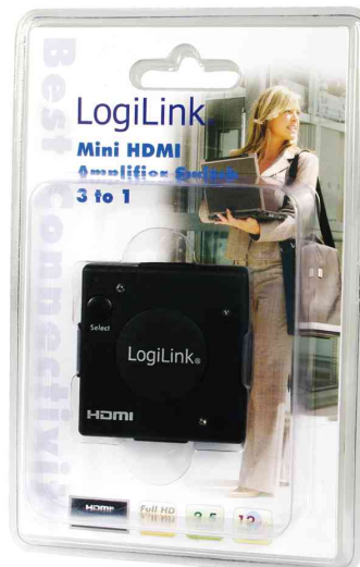
Mini commutateur HDMI avec amplificateur, 3 ports - en emballage