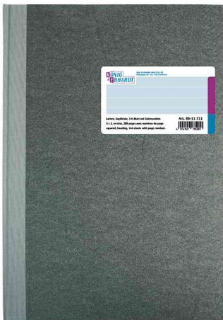
Livre de compte format A4, couverture rigide