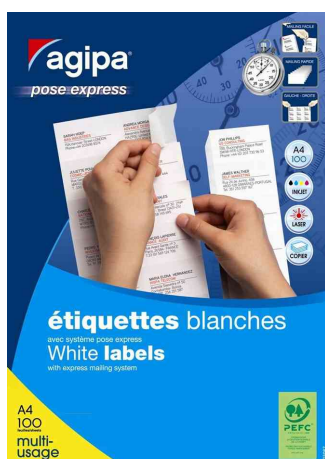
Étiquettes multi-usage - Pose Express