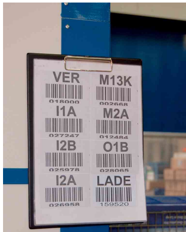
plaque avec revêtement en plastique et aimants néodyme, exemples d'utilisation