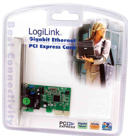
Adaptateur réseau PCI Express Gigabit Ethernet