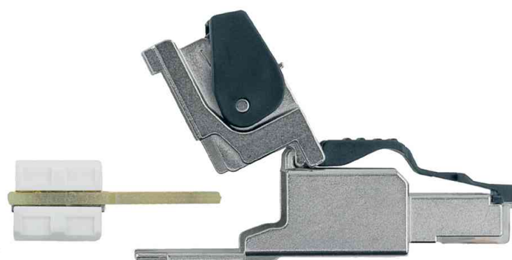
Connecteur Rj45 MFP8