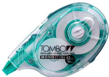
Roller correcteur MONO YX, réutilisable, 4,2 mm x 16 m