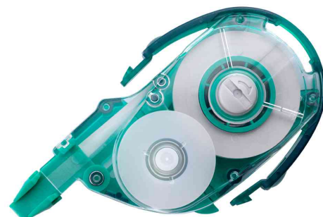
cassette de recharge pour roller correcteur