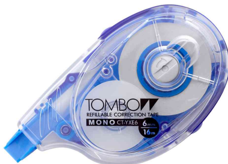
Roller correcteur MONO YX, réutilisable, 6,0 mm x 16 m