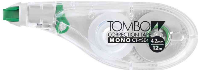
Roller correcteur jetable MONO "EASY WRITE TAPE", 4,2 mm x 12 m