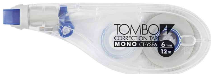
Roller correcteur jetable MONO "EASY WRITE TAPE", 6,0 mm x 12 m