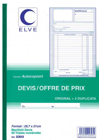
Manifold - Devis/Offre de prix