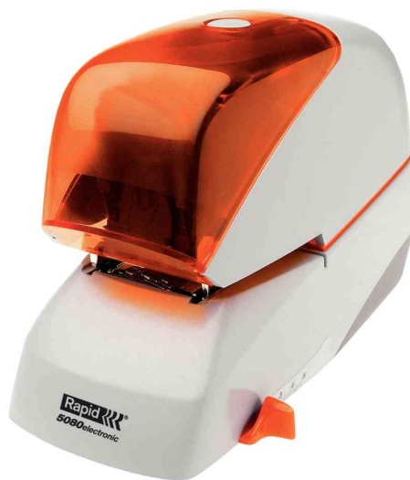
Elektroheftgerät 5080e, silber / orange