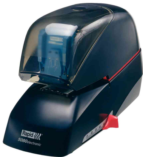
Elektroheftgerät 5080e, schwarz