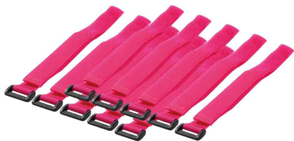
Attache-câble en velcro, 500 x 20 mm