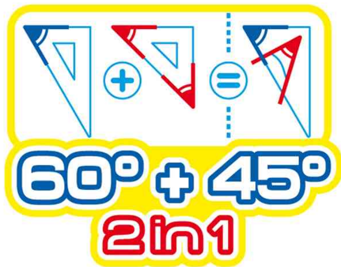
Zeichendreieck 2 in 1