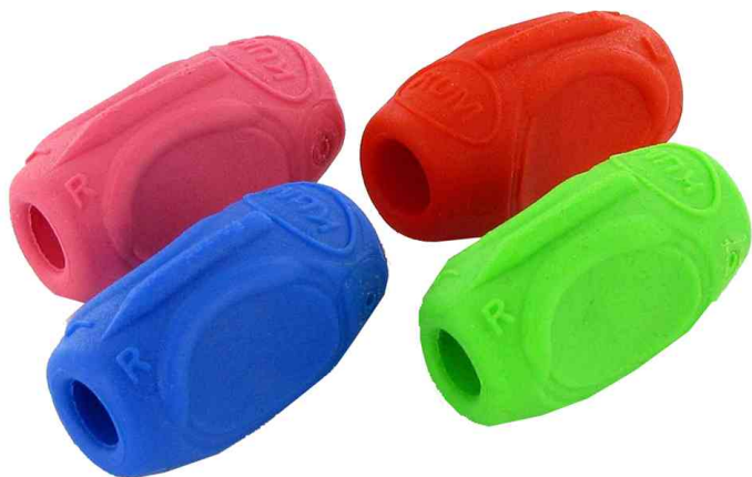
Porte-grip pour stylo Sattler Grip