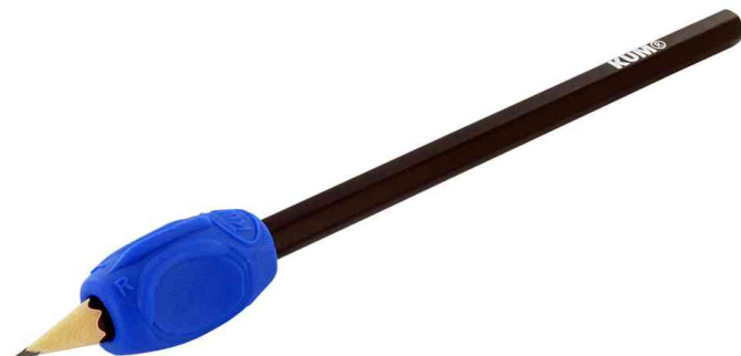
Porte-grip pour stylo, utilisation