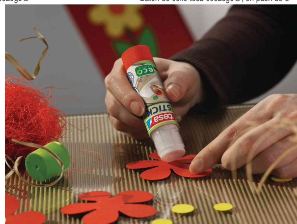
Exemple d'utilisation: aide pour le bricolage