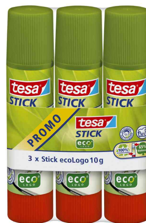
Bâton de colle tesa ecoLogo®, en pack de 3