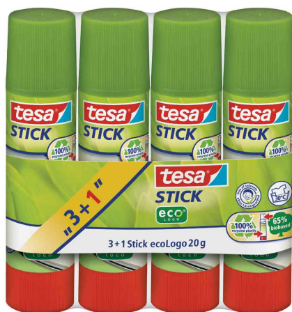
Bâton de colle "3+1" tesa ecoLogo®