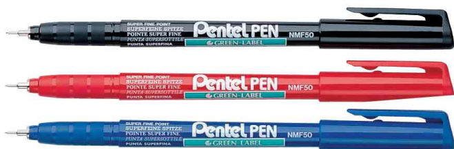
Marqueur permanent GREEN-LABEL NMF50