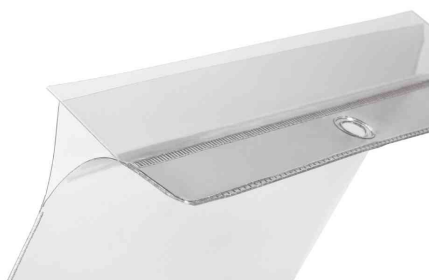
Avec clapet de protection