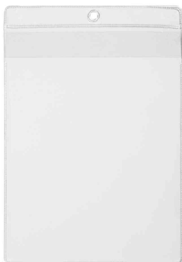
Pochette transparente pour dossier suspendu