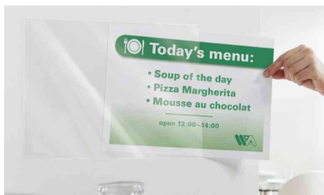
Remplacer l'étiquette rapidement et simplement