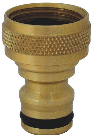
Embout de robinet pour 1/2 filetage

• adaptateur fait avec précision • en laiton massif • résistant à l'usure, à la rouille contrairement au plastique • compatible avec tous les types de système • le laiton a contrairement au plastique l'avantage de ne pas éclater quand il ya gelée s'il reste de l'eau dans la liaison • est vissé au robinet avec un 1/2 de filetage et permet la connexion à l'adaptateur du tuyau, par exemple 18004989, 18004992 oder 18004998