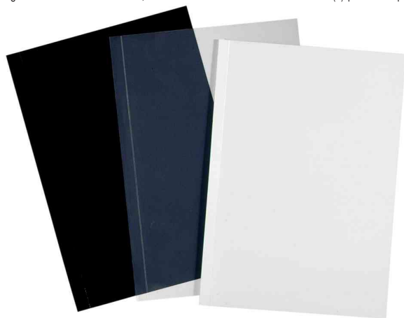
(4) set de couvertures