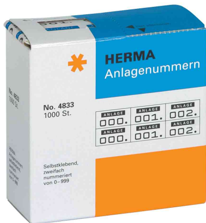
Anlagennummern, im Kartonspender