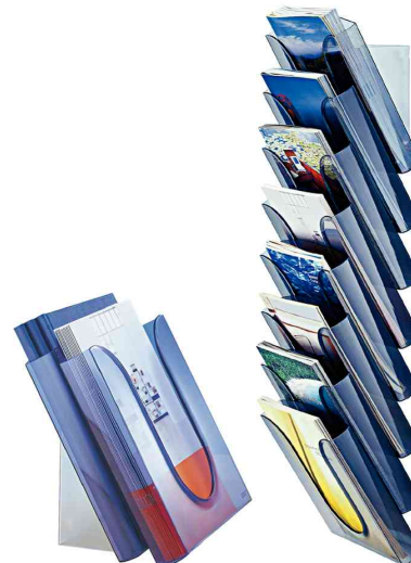
solution table - montage sur mur