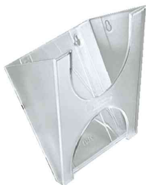
accessoires: adaptateur universel