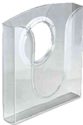
porte brochures pour sur table et sur mur