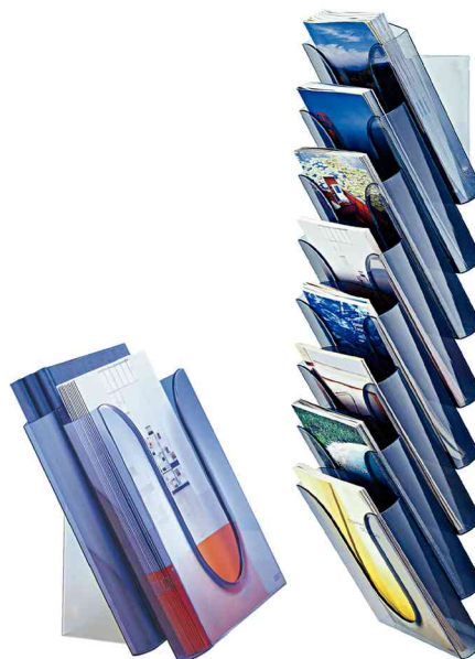
solution table - montage mural