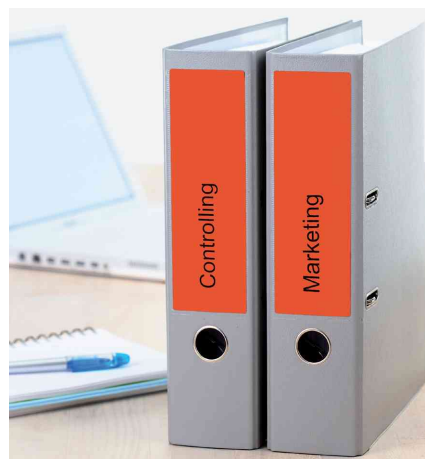
Étiquettes de dos de classeur, utilisation