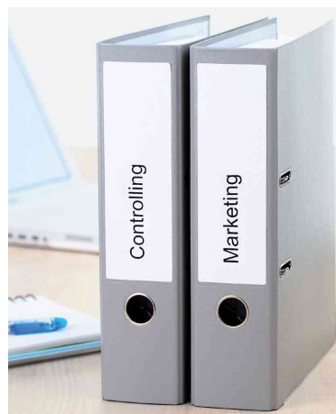
Dos de classeur-étiquettes spécial, utilisation