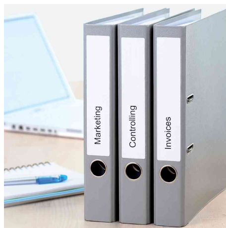
Étiquettes pour dos SPECIAL, utilisation