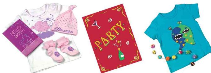
Peinture à relief 3D-Liner, utilisation